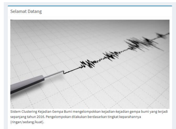
Gambar 3.1. Antarmuka Home

Halaman Home adalah halaman awal yang terbuka ketika user mengakses website. Halaman ini berisi informasi singkat mengenai sistem yang dibuat.